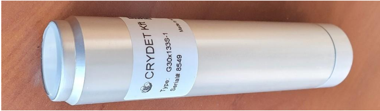
KGCT-3-80-43D szcintillációs kristály