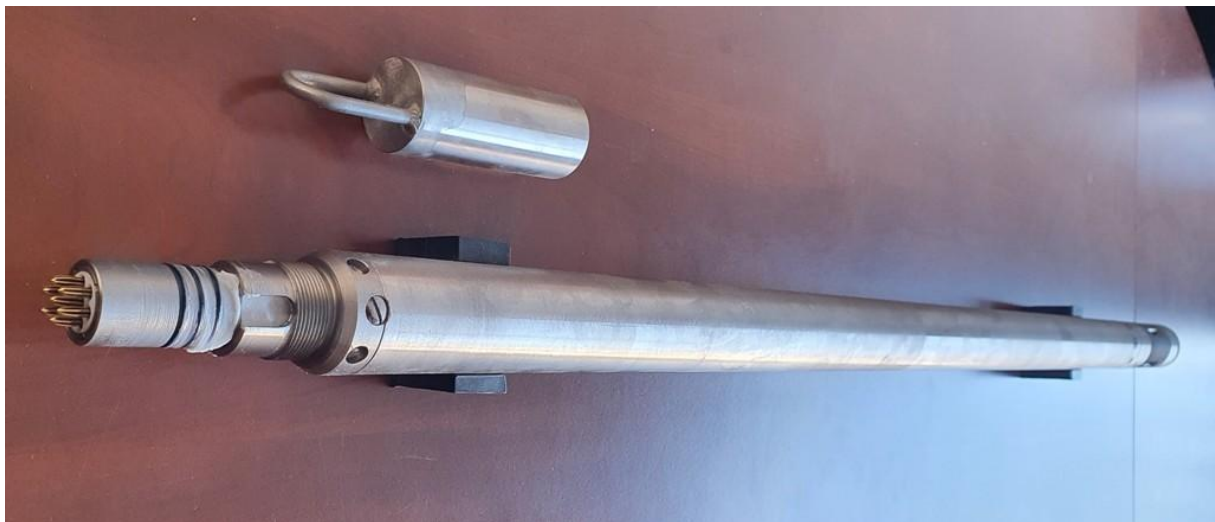
KG-1-80-43D típusú szerelt szondaház, szondafejjel