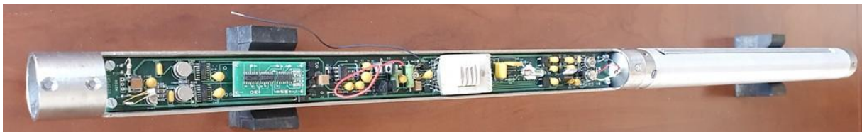
KGCT-3-80-43D elektronika szerelés közben