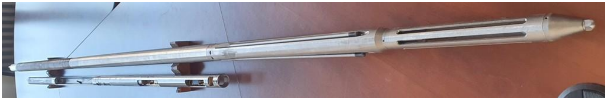
KGCT-3-80-43D típusú szerelt szondaház, szondafejjel